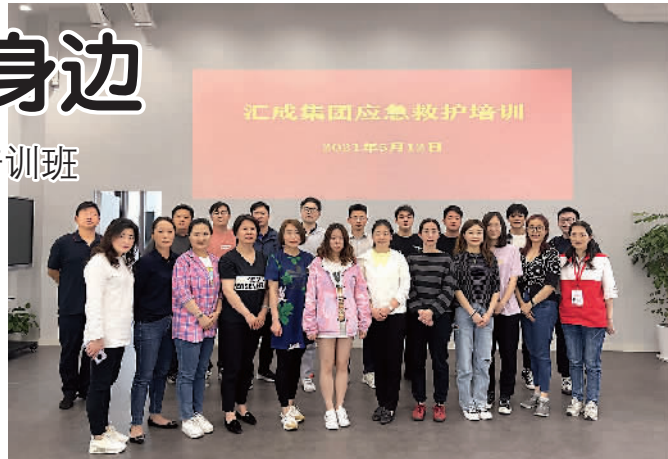
汇成集团应急救护培训班合影

的应急救护培训知识。守护生命，“救”在身边。关爱生命，敬畏生命，珍惜生命，及时正确地进行事故抢救，除了明显提高降低致残率外，还可以大大降低死亡率。此次应急救护培训，意义